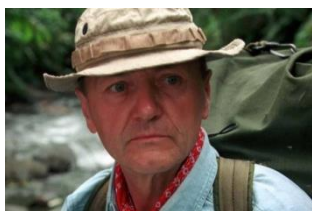
А) Палкевич Яцек

12. Укажите имя путешественника, который много раз бывал в автономном существовании в природной среде. Принадлежит много рекордов, один из которых абсолютный мировой рекорд для аэростата, облетов вокруг земного шара за рекордно короткое время: 11 дней 4 часа 20 минут или 268 часов 20 минут.