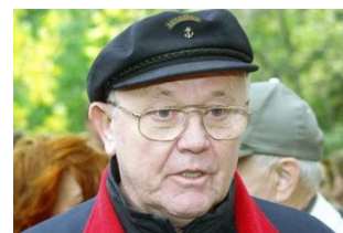
Г) Юрий Сенкевич