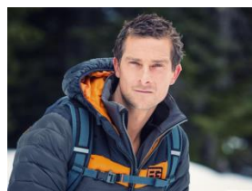
В) Беар Гриллс