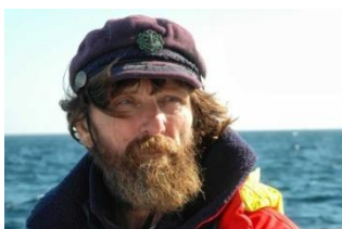
Б) Федор Конюхов